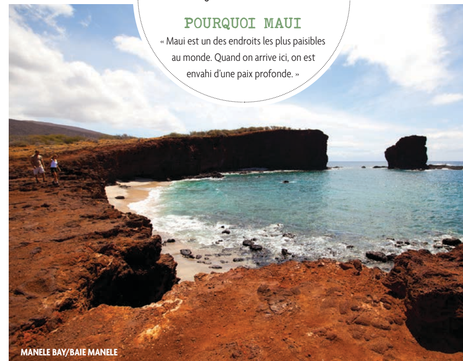
MANELE BAY/BAIE MANELE

« Maui est un des endroits les plus paisibles au monde. Quand on arrive ici, on est envahi d'une paix profonde. »