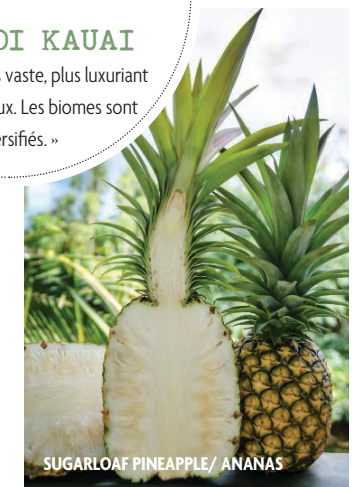
SUGARLOAF PINEAPPLE / ANANAS

and yachts will dock. In the winter, it's a great place to surf. There are huge waves. If you go to Waikoko Beach [at the end of the bay], you really want to know what you're doing, but it's safe for beginners by the pier."