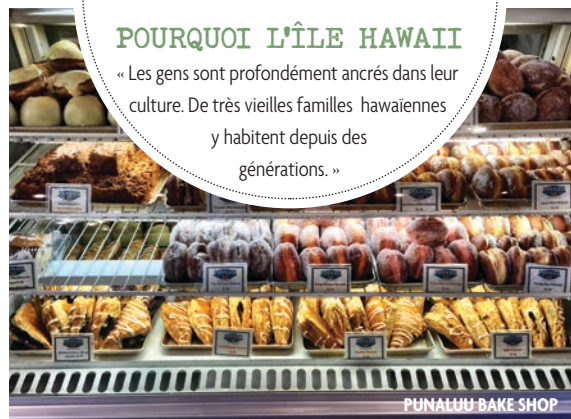
PUNALUU BAKE SHOP

« Les gens sont profondément ancrés dans leur culture. De très vieilles familles hawaïennes y habitent depuis des générations. »