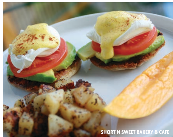
SHORT N SWEET BAKERY & CAFE