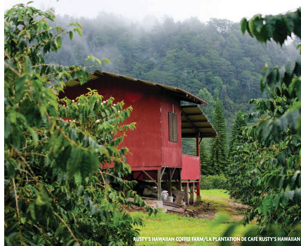
RUSTY’S HAWAIIAN COFFEE FARM/LA PLANTATION DE CAFÉ RUSTY’S HAWAIIAN

POMAI WEIGERT PHOTO BY JESSICA PEARL, PUNALUU BAKE SHOP PHOTO BY ANDREW COLDHAM, HULIHEE PALACE PHOTO COURTESY OF HAWAII TOURISM AUTHORITY (HTA) AND TOR JOHNSON