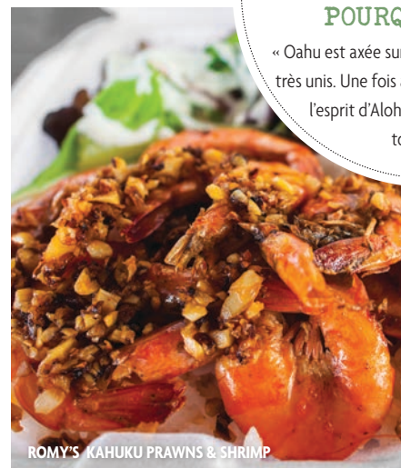
ROMY'S KAHUKU PRAWNS & SHRIMP

« Oahu est axée sur la famille et ses gens sont très unis. Une fois ami avec l'un d'entre nous, l'esprit d'Aloha sera avec vous pour toujours. »