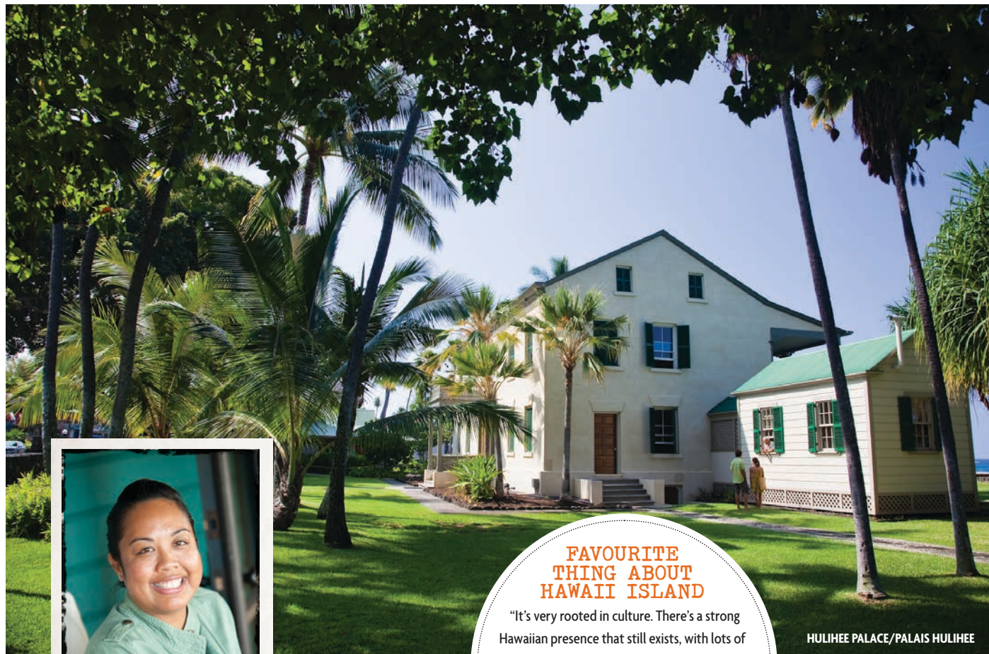
HULIHEE PALACE/PALAIS HULIHEE