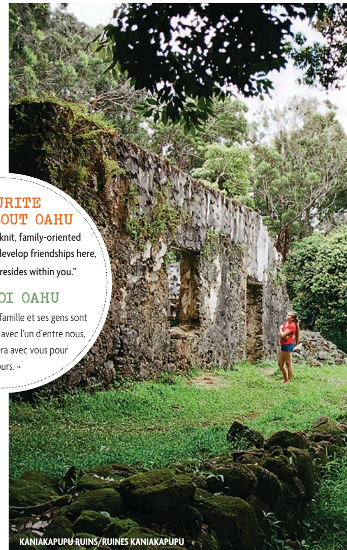
KANIAKAPUPU RUINS/RUINES KANIAKAPUPU