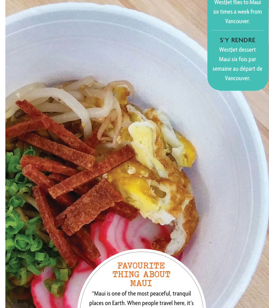
PLATE LUNCH FROM TIN ROOF/L'ASSIETTE DE DÉJEUNER AU TIN ROOF

TAMURA'S FINE WINE [DIVERS EMPLACEMENTS] « Non seulement Tamura propose le plus grand choix de vins, de bières et d'alcools dans tout l'État, mais il a la réputation d'offrir le plus grand choix de pokes. Une foule de gens y fait la queue pour le poke de pieuvre, de pétoncles ou de kimchi, des légumes assaisonnés. Tamura propose au moins deux douzaines de choix, et il ne reste jamais rien à la fin de la journée. » —Alyssa Schwartz