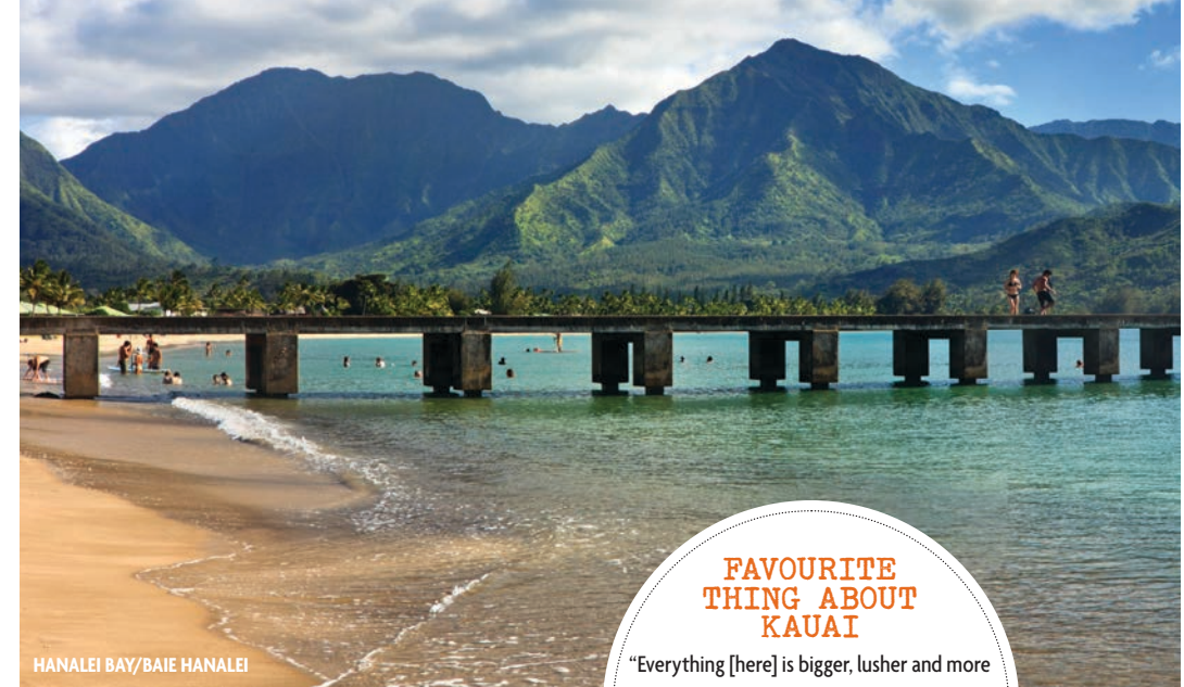
HANAIE BAY/BAIE HANAIE

ALETHA THOMAS