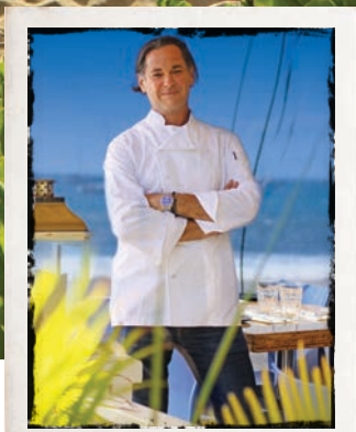
CANOE BEACH/PLAGE CANOE